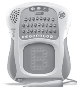
Scribble and Write 3+ years