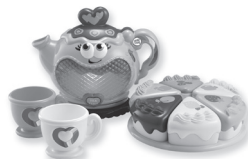
Musical Rainbow Tea Party 1+ year