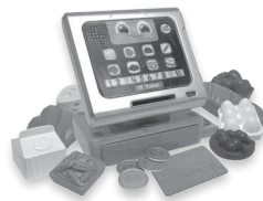
Count Along Register/Till 2+ years

Recycle. Find out how to recycle this product at leapfrog.com/recycle or call (800) 701-5327. For UK consumers, visit leapfrog.co.uk/recycle .