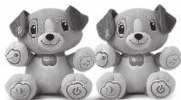
My Pal Scout/Violet™ 6+ months