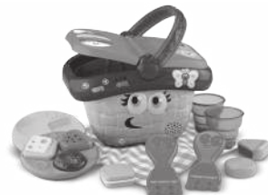
Shapes & Sharing Picnic Basket 6+ months