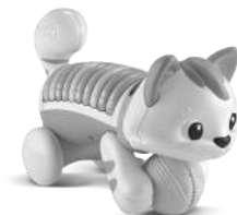
Count & Crawl Kitty 9+ months

Recycle. Find out how to recycle this product at leapfrog.com/recycle or call (800) 701-5327. For UK consumers, visit leapfrog.co.uk/recycle .